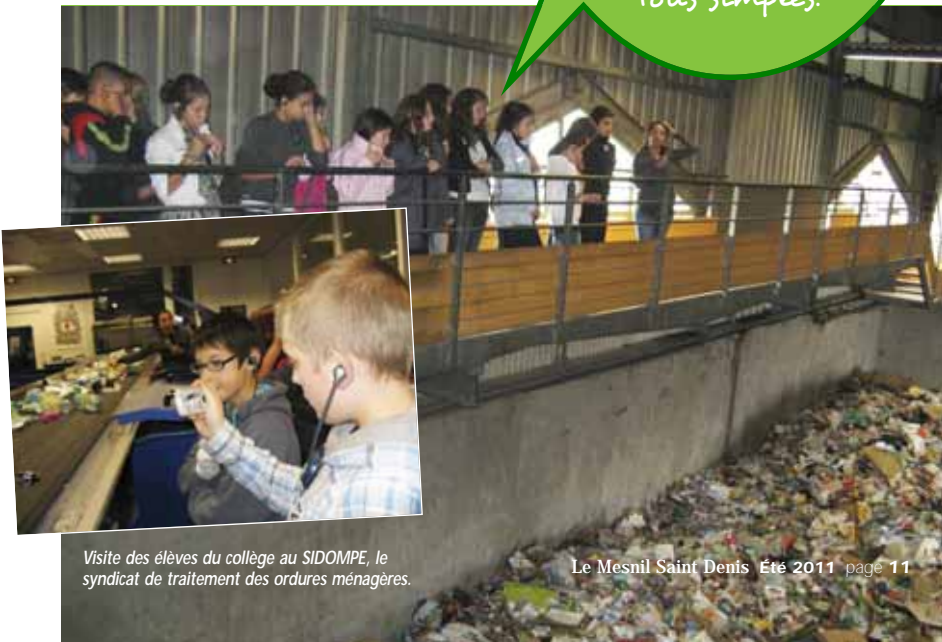
Visite des élèves du collège au SIDOMPE, le syndicat de traitement des ordures ménagères.

Chaque citoyen peut, par des actions concrètes et simples, œuvrer, au quotidien, pour limiter la croissance des quantités de déchets que nous produisons ; les principes en sont tous simples.