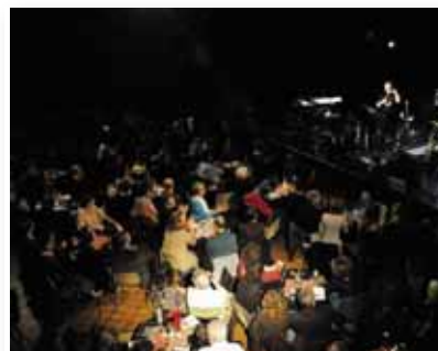
▲ La salle de concert du CLC s'était muée en cabaret jazz pour l'occasion.