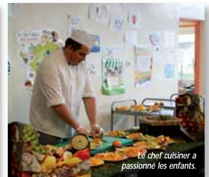
Le chef cuisiner a passionné les enfants.

Dans le cadre d'un nouveau marché comportant l'introduction du bio dans les menus de la restauration scolaire, une animation intitulée « Le petit train du bio », organisée par notre prestataire RGC, a été proposée dans chacune des cantines du Mesnil. La présence du chef en tenue qui préparait le dessert devant les enfants a été très appréciée. Ce fut l'occasion pour les élèves de l'interroger sur son métier, sur les produits, etc. Alors que la prestation habituellement servie prévoit 1 fruit ou 1 légume bio et 1 laitage ou 1 fromage bio par semaine ainsi qu'une viande de race bouchère par mois, le menu spécial de ce jour particulier était entièrement bio : carotte râpée, poulet et pâte, yaourt nature et assiette de fruits frais.