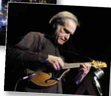
Les Topinambours ont assuré et mis la patate en première partie ! ▼