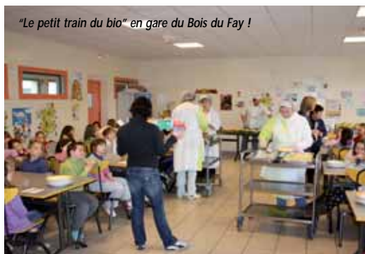
"Le petit train du bio" en gare du Bois du Fay !