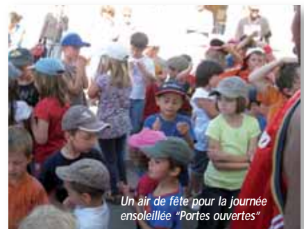
Un air de fête pour la journée ensoleillée "Portes ouvertes"