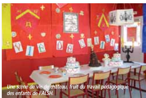
Une scène de vie de château, fruit du travail pédagogique des enfants de l'ALSH.

Dans les missions fixées par la commune à ce prestataire entraine celle de travailler avec les enfants sur un nom et un logo pour les bâtiments situés 15 rue du Maréchal Joffre. Le nom étant trouvé, un groupe de 6 enfants a été désigné pour dessiner avec l'aide d'un graphiste mesnilois le futur logo.