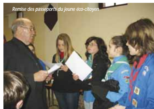
Remise des passeports du jeune éco-citoyen

Mention spéciale pour les services techniques toujours disponibles, présents même en dehors de leurs heures de travail. Ce samedi 19 mars vers 18 heures tous les déchets ramassés et réunis par nos soins à trois endroits étaient récupérés et déposés par les services techniques à la déchetterie. Merci à l'équipe pour son dévouement.